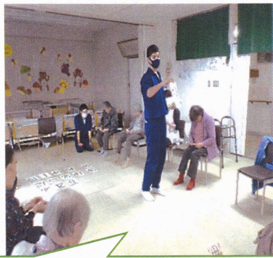
ビンゴゲーム大会 !!!