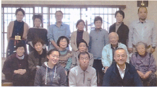
※写真撮影の際は、マスクを外しております。

今年度はコロナウィルスの影響で、向方地区・大久那地区のふれあい会や介護者交流会、ボランティアさんの交流集会等、多くの行事を中止させていただきました。