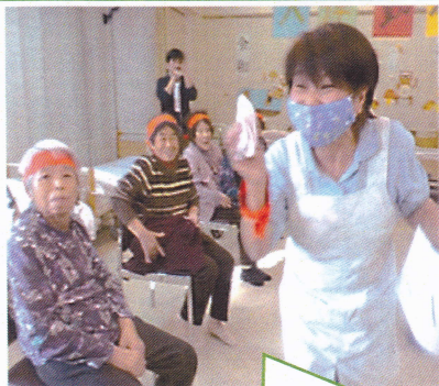
赤・白 頑張れ !!!