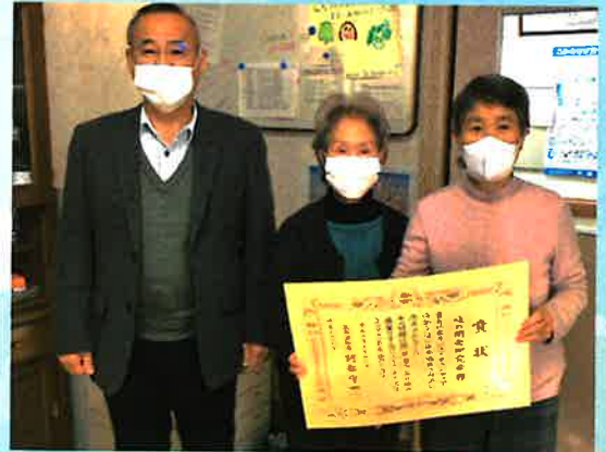
▲コロナ禍のため、県知事代理で当社協会長より表彰状が授与されました。