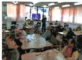
ホールに集まって、 年頭のあいさつを行いました。