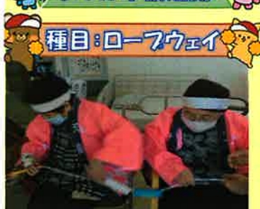
種目:ロープウェイ