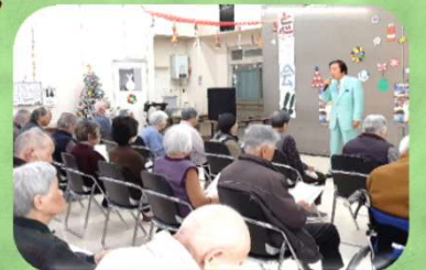
宮内ひろし様 歌謡ショー